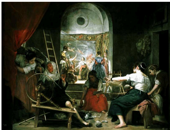
Las Hilanderas (1657). Velázquez

Velázquez, el cuadro dentro del cuadro, la obra perfecta. Me gusta perderme por sus cuadros una y otra vez, descubrir algo nuevo, emocionarme e impregnarme de sus colores, de su luz.