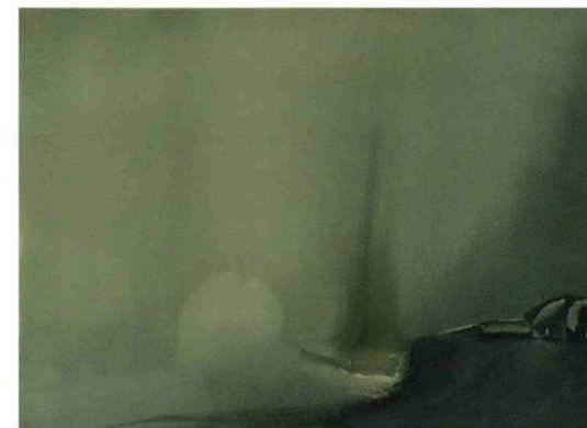
Tormenta. Isabel Fuster

La preocupación por el vacío espiritual que padecemos actualmente y el lugar que ocupa el arte, se consume, no se disfruta.